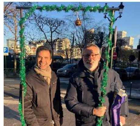
Le déjeuner de Noël offert par la Table de Cana