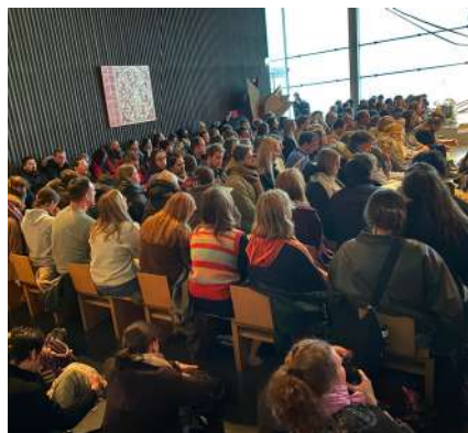
Les jeunes de Taizé à Notre-Dame de Pentecôte