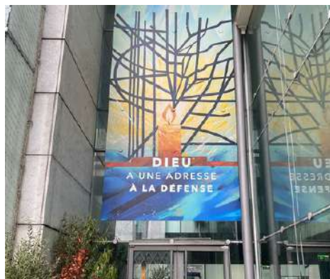
La nouvelle bannière de Notre-Dame de Pentecôte a été installée