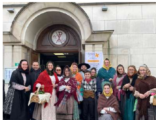
La fête des Rois organisée par l'Association Catholique Portugaise