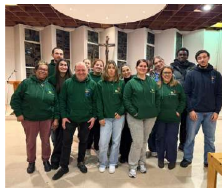
Vœux des animateurs de l'aumônerie : « Notre mission est précieuse, alors continuons, allons-y dans l'unité, dans la paix, dans la vérité, en étant fiers de nos talents, en mettant en valeur notre foi avec le Christ notre Sauveur. »