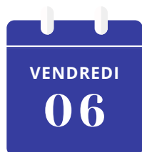
Table Ouverte Partagée

19h15 salle des Cailloux, Chacun apporte de quoi partager.