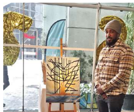
25 ans de Notre-Dame de Pentecôte – La Défense, en présence du vicaire général